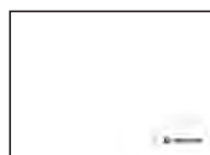
DW1: SENOSCREEN®-UV- RELIEF-GLANZLACK 82S 7220