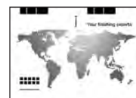
DW1: SENOSCREEN®-UV- GLANZLACK KAT- IONISCH 82S 4210