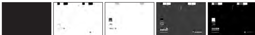
LW1: SENOLITH®-WB-FP MATTPRIMER 20F 2000