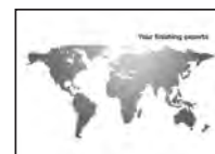
KURZ ALUFIN® MSU in Silber